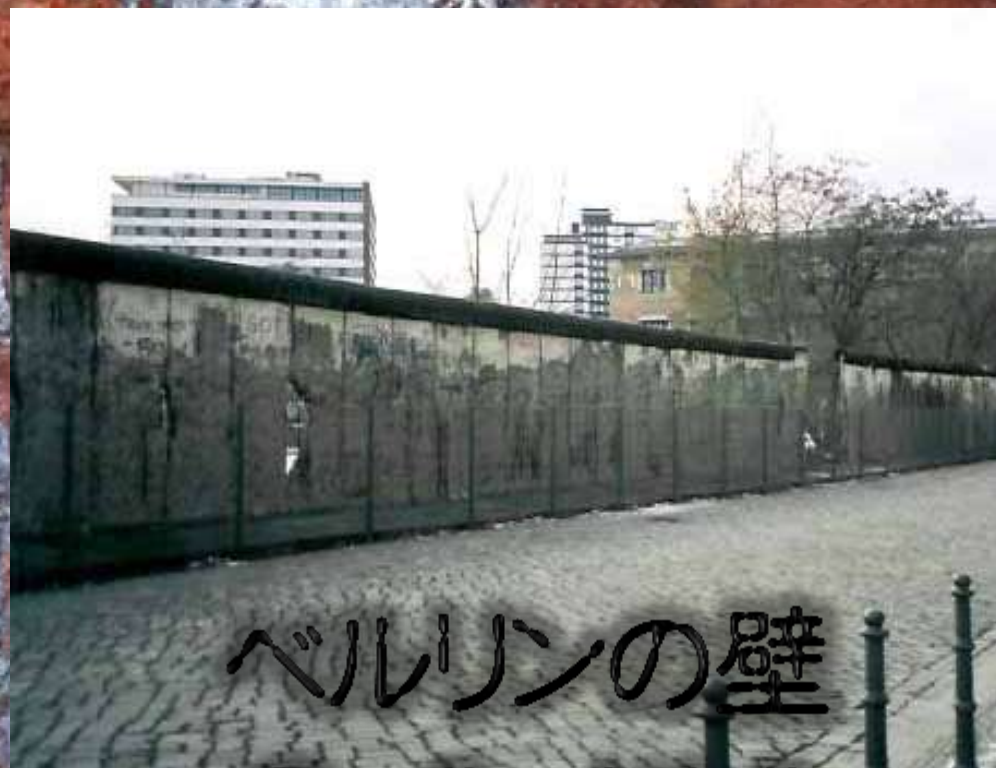
ベルリンの壁 Berlin Wall