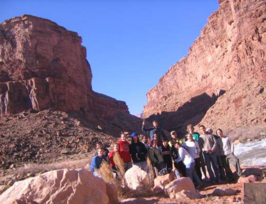
Mission trip to Tuba City, Arizona in 2006