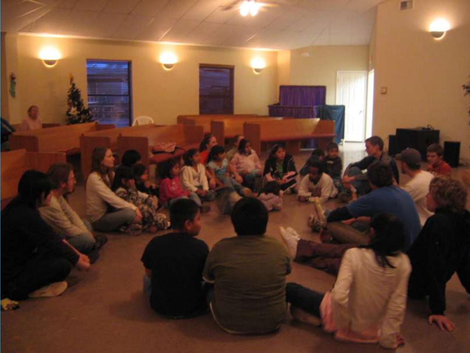
VBS during mission trips in Tuba City, AZ 宣教旅行中の子供の聖書クラス