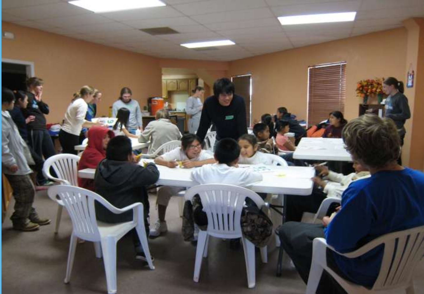
VBS during mission trips in Tuba City, AZ 宣教旅行中の子供の聖書クラス